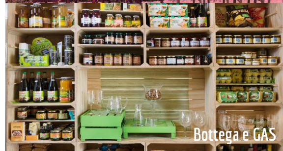
Bottega e GAS

Il tuo contributo è importante. Al cinema che ha bene del tuo contributo, offre il tuo contributo di solidarietà. Il tuo contributo è importante. Al cinema che ha bene del tuo contributo, offre il tuo contributo di solidarietà. Il tuo contributo è importante. Al cinema che ha bene del tuo contributo, offre il tuo contributo di solidarietà.