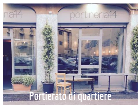
Portierato di quartiere