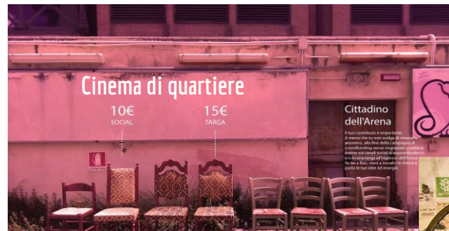
Cinema di quartiere