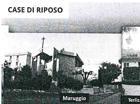
CASE DI RIPOSO

La casa di riposo “Maria Immacolata” di Maruggio è immersa nel verde, circondata da pini ed uliveti, ed ospita 50 anziani che alloggiano in camere singole o doppie, munite di tutti i conforti. La casa [...]