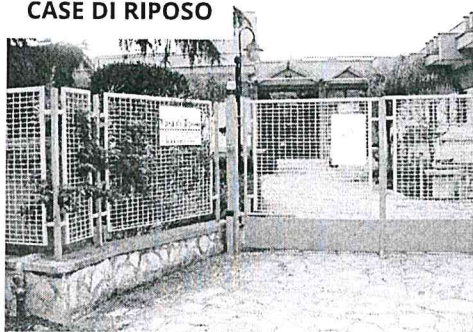
CASE DI RIPOSO