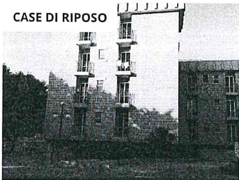
CASE DI RIPOSO

La casa, nata come accoglienza degli accattoni del dopo guerra per volontà del sacerdote Ambrogio Grittani, si è assediata divenendo casa madre e generalizia e centro propulsore della vita della Congregazione. La struttura ospita circa [...]