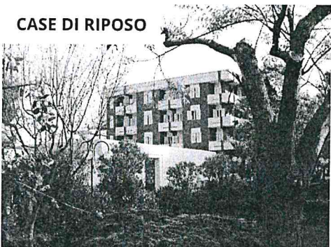
CASE DI RIPOSO

La casa di riposo “Madonna di Sovereto” è ubicata a Sud della città. E' circondata da un ampio giardino, con sul prospetto alberi di abeti, ulivi e aiuole di fiori; sul retro ulivi e un'ampia [...]