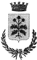
Comune di Modugno